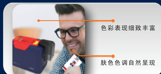
采用热升华打印的照片品质输出

双界面芯片卡读写模块 非接触式ID卡读写模块 UHF芯片卡读写模块 磁条卡读写模块